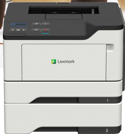
M1242 mit optionalem Fach