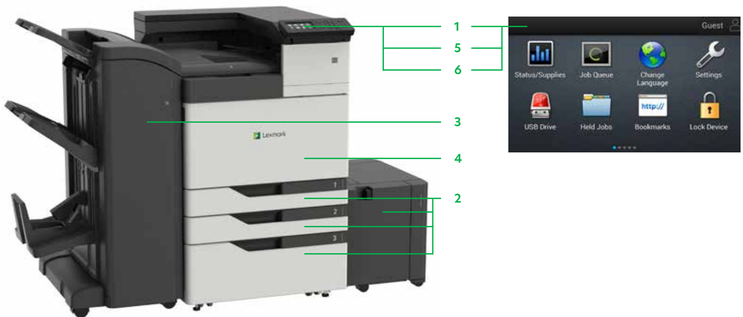
C9235 mit Optionen

Drucken Sie Microsoft Office-Dateien, PDFs und andere Dokument- und Bildarten von Flash-Laufwerken, oder wählen Sie Dokumente auf Netzwerk-Servern oder Online-Laufwerken aus und drucken Sie sie.