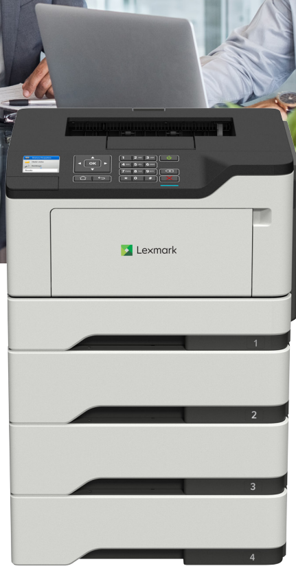
M1246 mit optionalen Fächern