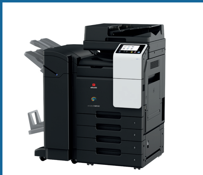
mit FS-539SD und PC-218